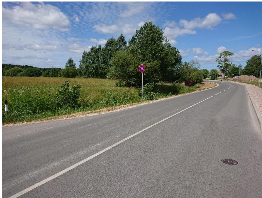
1.attēls. Skats uz detālpilānojuma teritoriju no Rānavas ielas