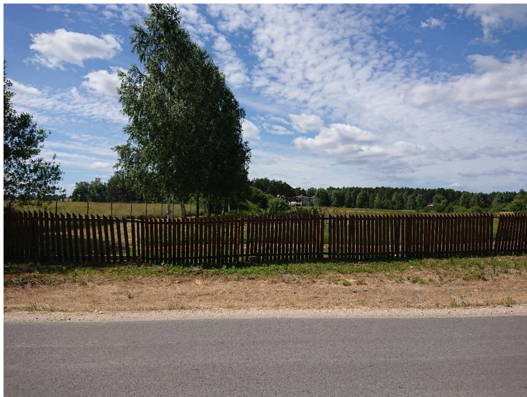
3. attēls. Skats uz detālplānojuma teritoriju no detālplānojuma teritorijas Rāmavas ielas

Detālplānojuma teritorija atrodas Ķekavas novada, Ķekavas pagasta Rāmavas ciemā, ar tiešu piekļuvi no Rāmavas ielas kura ir Ķekavas novada pašvaldības īpašumā esoša iela.